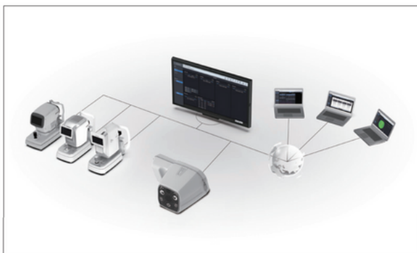
Red en el Servidor de Imágenes Integrado