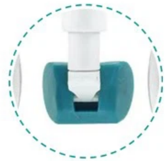
Almohadilla de silicona nasal

Clasificación: Dispositivo Médico Clase I.