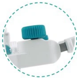
Rueda plana para ajustar el ángulo de la patilla