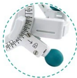
Rueda para ajustar y fijar el eje