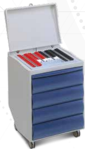
Cassetiera 65NE1 Chest of drawer 65NE1

Opzionali disponibili: Braccio autobilanciato orizzontale art. 63AB o 63CD Caricatore strumenti art. 65PCR Available optionals: Horizontal counterbalanced arm art. 63AB or 63CD Rechargeable wells art. 65PCR