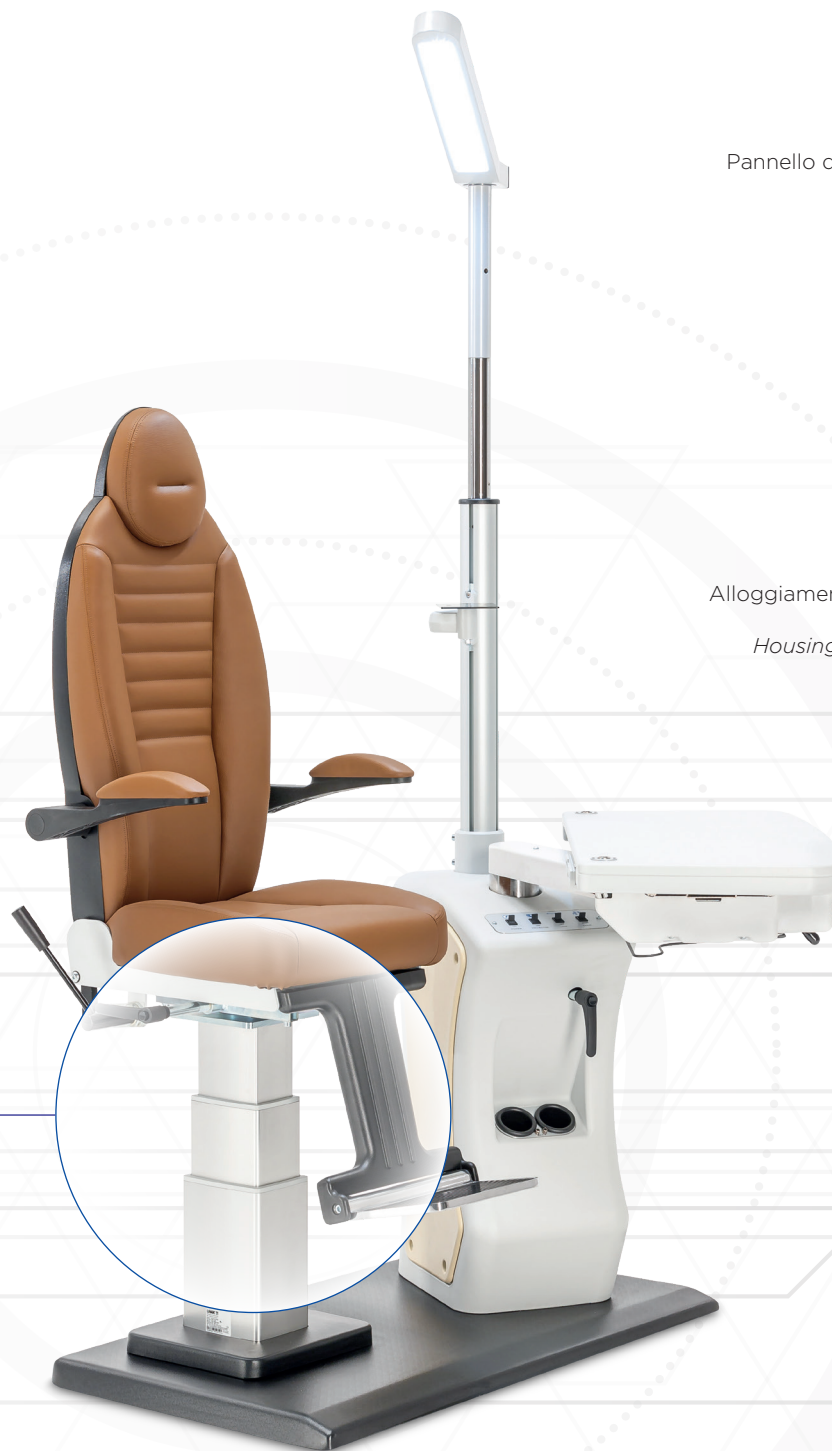
Pannello di comando riunito Unit control panel

MAXIMUM HEIGHT INCREASED MASSIMA ALTEZZA AUMENTATA